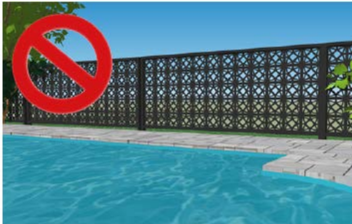
Exemple de clôture ornementale qui peut être escaladée facilement.

Pour les clôtures en mailles de chaîne, les mailles doivent être d'au plus 50 mm et être munies de lattes .