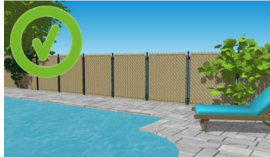
Exemple de clôture en mailles de chaîne lattée.

L'enceinte doit empêcher le passage d'un objet sphérique de 10 cm de diamètre et doit être d'une hauteur de 1,2 mètre.