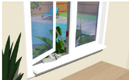
Limiteur d'ouverture pour fenêtre.

Un mur peut être pourvu d'une fenêtre si elle est située à une hauteur minimale de 3 m par rapport au sol du côté intérieur de l'enceinte, ou dans le cas contraire, si son ouverture maximale ne permet pas le passage d'un objet sphérique de 10 cm de diamètre.